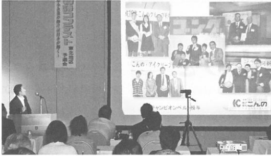
自社の軌跡をプレゼンテーションする紺野社長